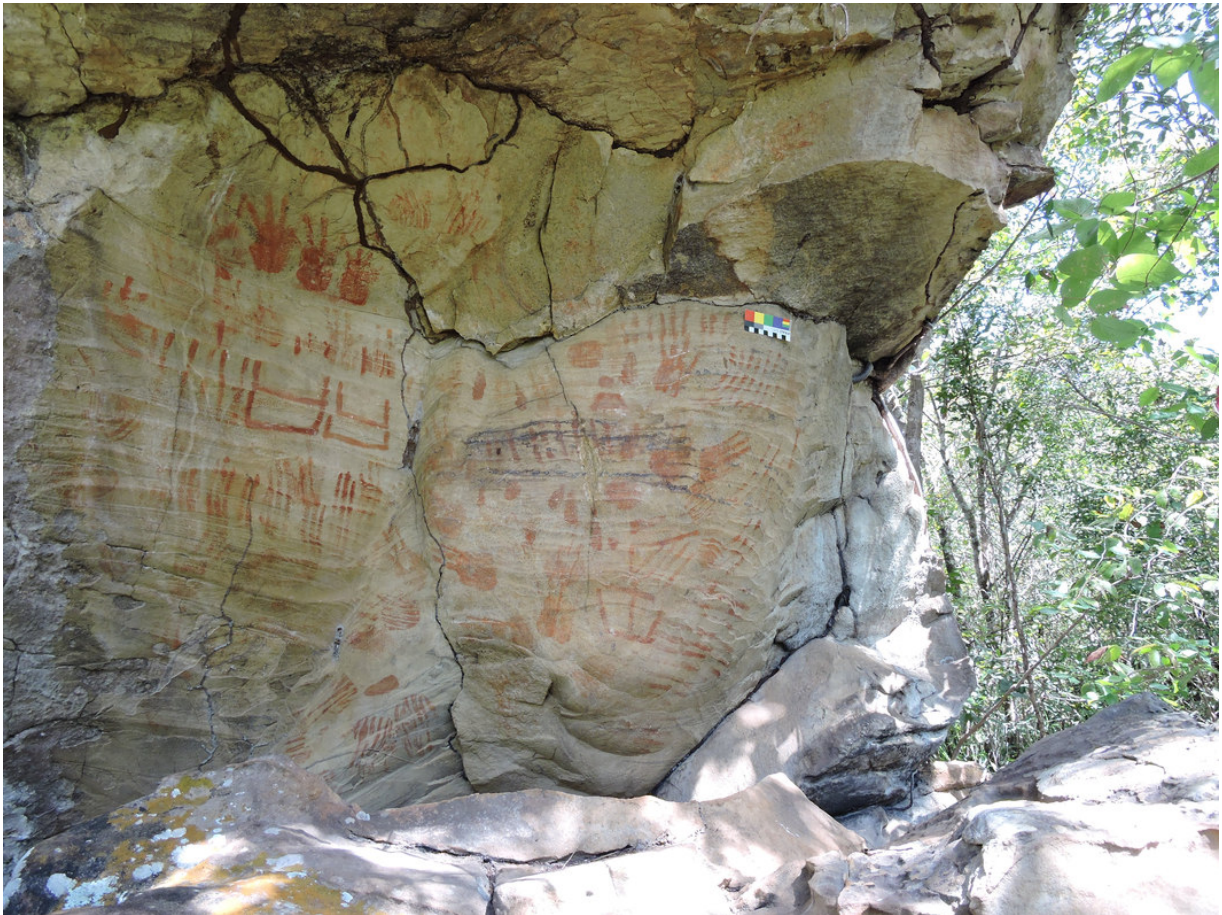
Figura 2. Vista panorâmica do pequeno abrigo elevado do sítio Pedra das Letras.