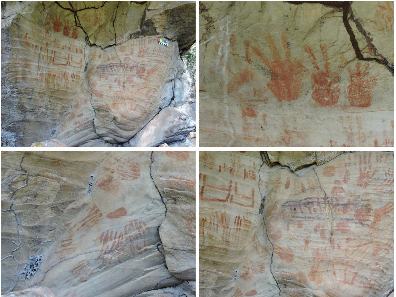
Figura 3. Detalhes das pinturas rupestres existentes na parede rochosa do abrigo do sítio Pedra das Letras.