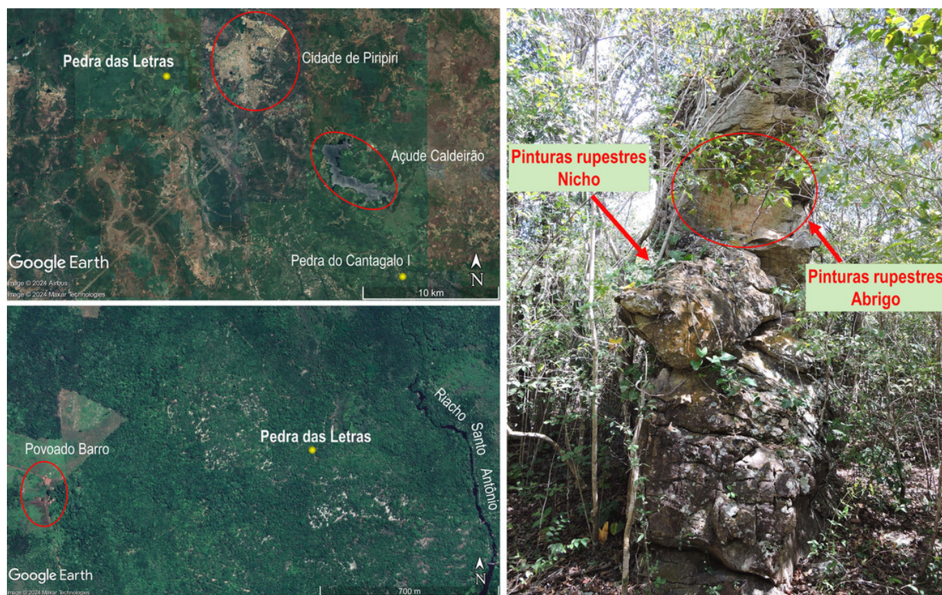
Figura 1. Localização do sítio arqueológico Pedra das Letras; vista panorâmica do bloco arenítico e detalhes da localização do pequeno abrigo elevado e do nicho lateral com pinturas rupestres.

Laboratório de Arqueometria e Arte Rupestre, Universidade Federal do Piauí (UFPI), Teresina, Piauí, Brasil (✉ cavalcanteufpi@ufpi.edu.br )